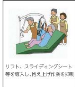
リフト、スライディングシート等を導入し、抱え上げ作業を抑制