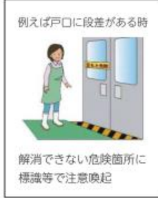
例えば戸口に段差がある時