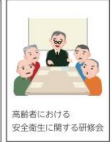
高齢者における安全衛生に関する研修会