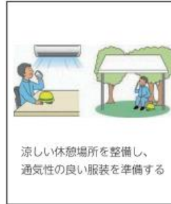
涼しい休憩場所を整備し、通気性の良い服装を準備する